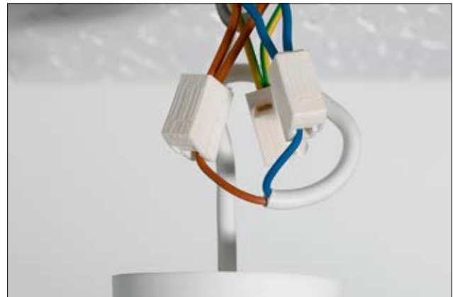
Schnelle Installation von Leuchten mit HelaCon Lux.