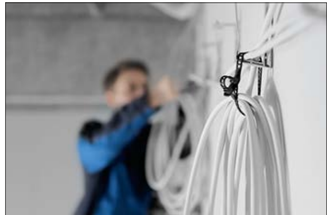
Durch die Elastizität der SOFTFIX Binder ist der Einsatz für viele Anwendungen möglich.