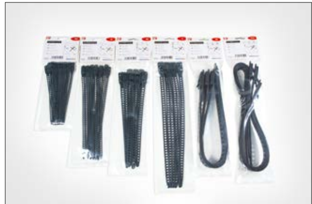
Die SOFTFIX Familie ist in praktischen Kleinverpackungen erhältlich.

i Mit zweiter Verriegelung für parallele Bündelung!