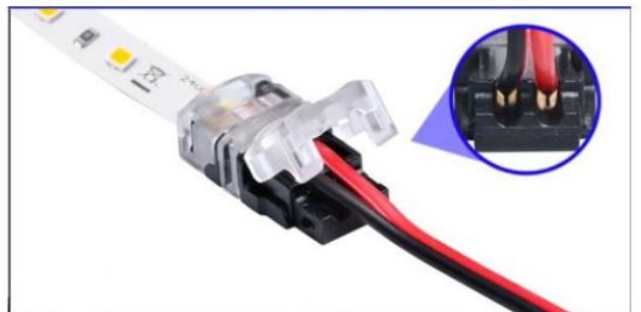
Die Kabellitzen in den Schneidkontakten platzieren