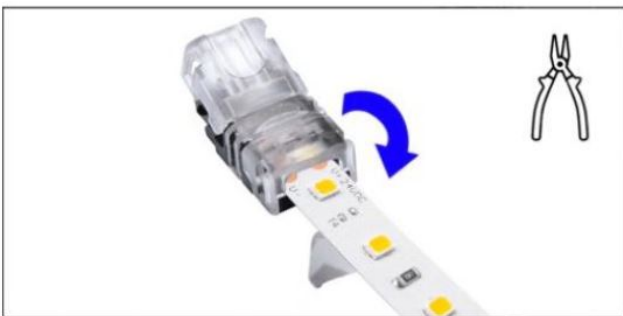
Den Konnektor mit eingelegtem LED-Streifen vorsichtig schließen. (Bei Bedarf eine Zange verwenden)