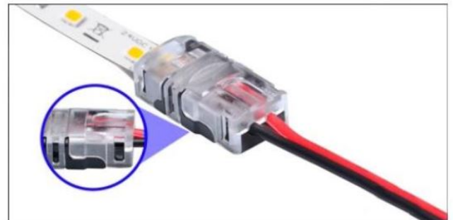
Die seitlichen Haltenasen müssen komplett einrasten