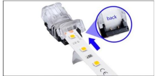
Den LED-Streifen im Konnektor auf den Pins platzieren