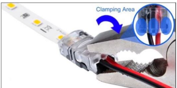
Den Konnektor mit eingelegten Kabellitzen vorsichtig schließen. (Bei Bedarf eine Zange verwenden)