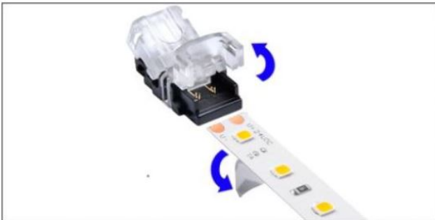
Das Streifenende des Konnektors öffnen und den Anfang der Schutzfolie des Klebebands entfernen