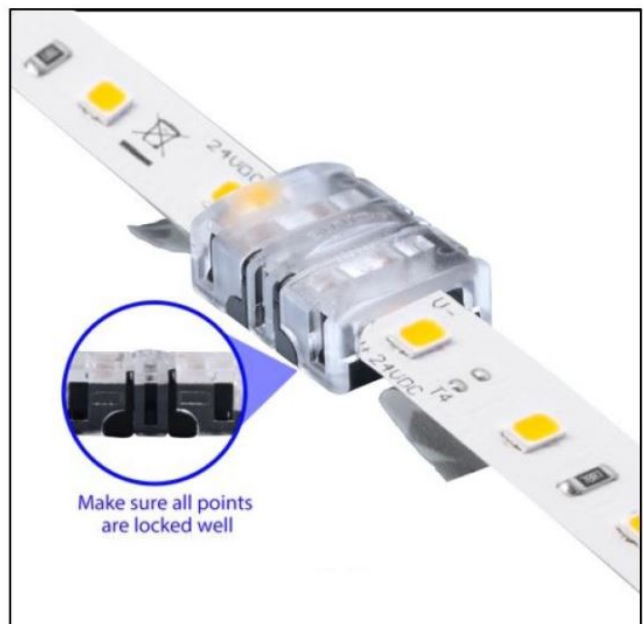
Die seitlichen Haltenasen müssen komplett einrasten