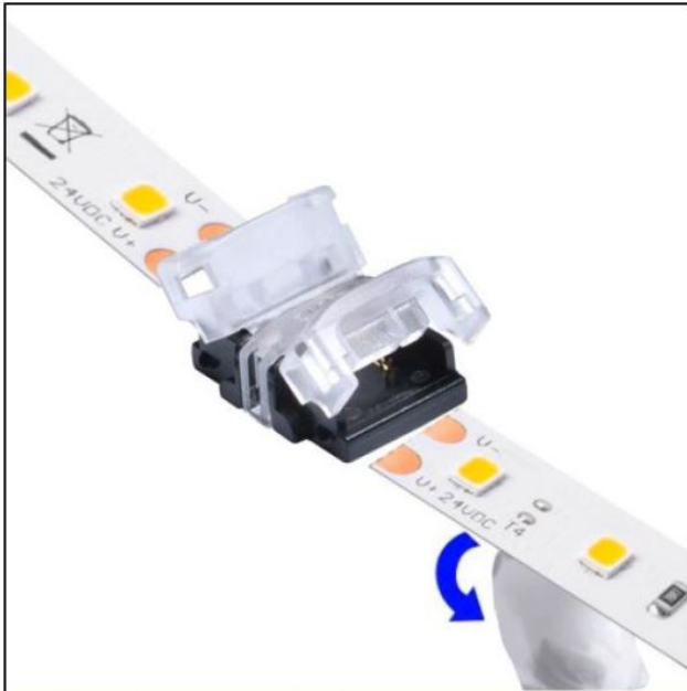
Den Konnektor öffnen und den Anfang der Klebebänder-Schutzfolien entfernen