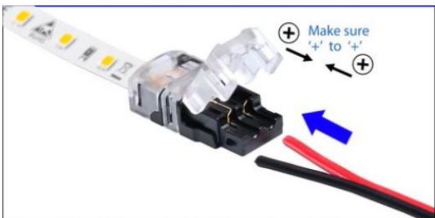
Das LED-Streifenende des Konnektors öffnen und die Anschlussleitung entsprechend der Polung des LED-Bandes einlegen