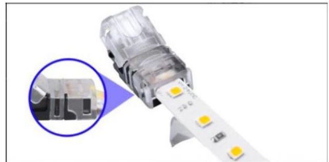
Die seitlichen Haltenasen müssen komplett einrasten