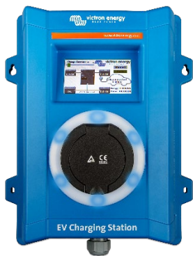
EV Charging Station