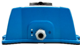
EV Charging Station - Rückseite