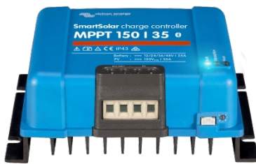
SmartSolar Lade-Regler MPPT 150/35