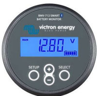
Bluetooth-Erkennung BMV-712 Smart Battery Monitor