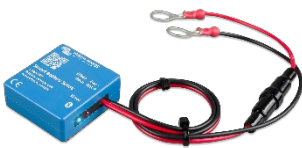
Bluetooth-Erkennung Smart Battery Sense