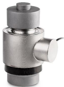
Abbildung mit Messzelle CD P1 (nicht im Lieferumfang)