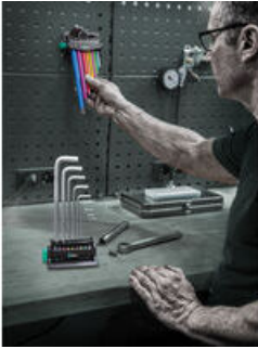
Rack zum Hinstellen auf den Tisch oder zur Befestigung an der Wand