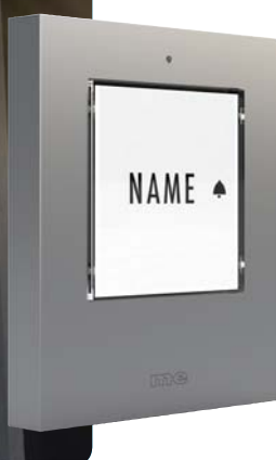
MOD. KTF-1 S Silber