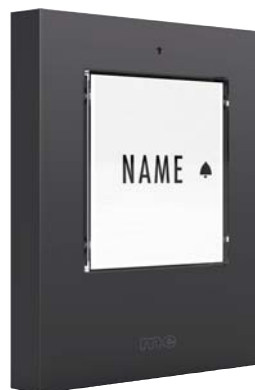
MOD. KTF-1 A Anthrazit