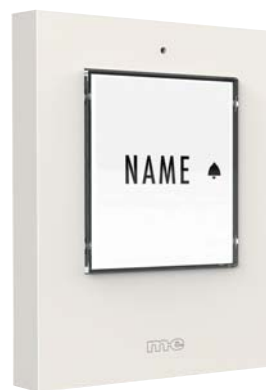
MOD. KTF-1 W Weiß

1-Familienhaus Taster in der Farbe silber, anthrazit oder weiß