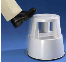
Detailansicht: 3 auf Federn gelagerte Gleitrollen