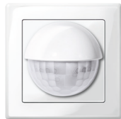
Argus 180 UP Sensor-Modul MEG5710-0319