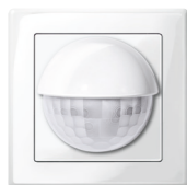
Argus Präsenz 180/2,20 m UP Sensor-Modul MEG5530-0319