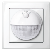
Argus 180 UP Sensor-Modul mit Schalter MEG5711-0319

Eingangs- und Durchgangsbereiche, Treppenhäuser und Flure