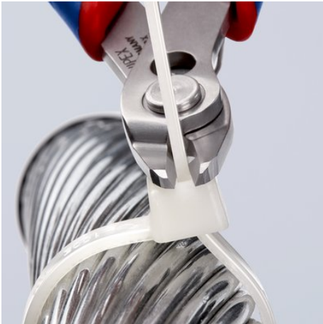
zum bündigen Schneiden, z. B. zum Einkürzen von Kabelbindern