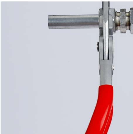
Abgewinkelte Griffe für mehr Greiffreiheit