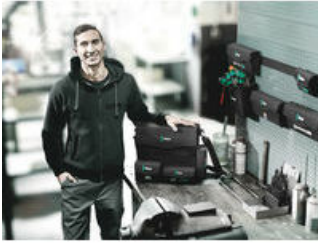
Wera 2go 2 - Der Dran- und Drinpacker