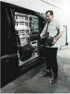
Wera 2go 1 - Der Dranpacker