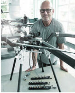
Die Wera Belts