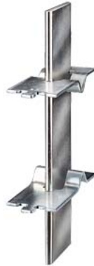
NH-Trennmesser Gr. 4A