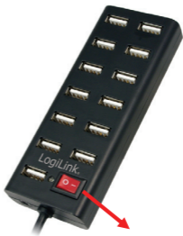
Interruptor de encendido / apagado