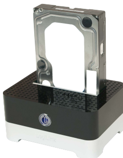
Instalar 3.5" HDD