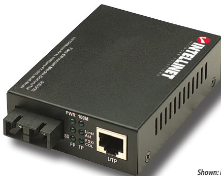
Shown: Model 506502