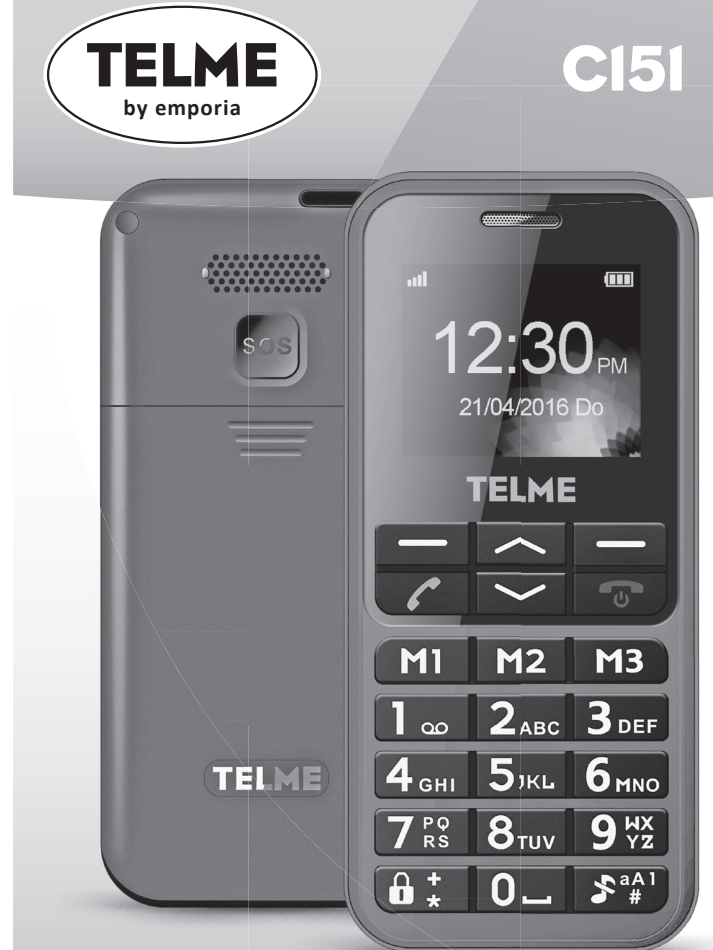
C151_ShortManual-V1d_S5292-ESP | 201608 | Sujeto a posibles errores de imprenta, errores y modificaciones técnicas.