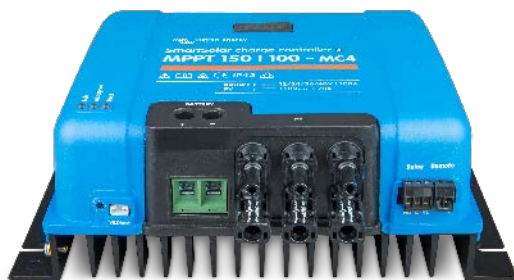
Controlador de carga solar MPPT 150/100-MC4 Sin pantalla