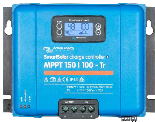
Controlador de carga solar MPPT 150/100-Tr Con dispositivo conectable