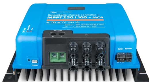
Controlador de carga solar MPPT 250/100-MC4 Sin pantalla