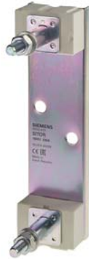
SITOR Sicherungshalter 1250A 1250V 1-polig mit Bolzenanschluss mit Befestigungsmaß 110mm