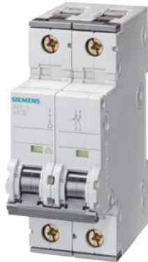
Leitungsschutzschalter 230V 10kA, 1+N-polig, A, 1.6A, T=70mm