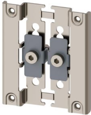
Strebenprofilmontage-Adapter für Gehäuse, Metall, sandgrau