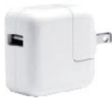
Adaptador eléctrico Type-C