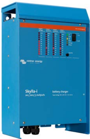
Skylla-i 24/100 (3)