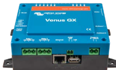
Ángulo frontal del Venus GX