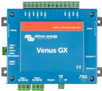
Venus GX con conectores