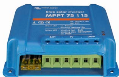
Controlador de carga solar MPPT 75/15