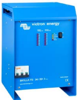
Skylla TG 24 50 3 phase

Para saberlo todo sobre las baterías, las configuraciones posibles y ejemplos de sistemas completos, pida nuestro libro gratuito "Energía Sin Límites" también disponible en www.victronenergy.com