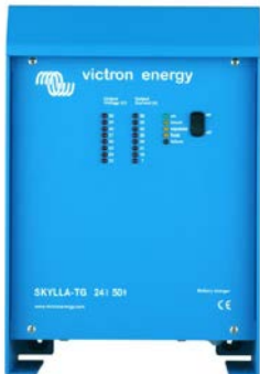
Skylla TG 24 50