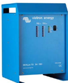
Skylla TG 24 100