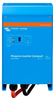
Phoenix Inverter Compact 24/1600

Todos los modelos disponen de un Puerto RS-485. Todo lo que necesita conectar a su PC es nuestro interfaz MK2 (ver el apartado "Accesorios"). Este interfaz se encarga del aislamiento galvánico entre el inversor y el ordenador, y convierte la toma RS-485 en RS-232. También hay disponible un cable de conversión RS-232 en USB. Junto con nuestro software VEConfigure , que puede descargarse gratuitamente desde nuestro sitio Web www.victronenergy.com , se pueden personalizar todos los parámetros de los inversores. Esto incluye la tensión y la frecuencia de salida, los ajustes de sobretensión o subtensión y la programación del relé. Este relé puede, por ejemplo, utilizarse para señalar varias condiciones de alarma distintas, o para arrancar un generador. Los inversores también pueden conectarse a VENet , la nueva red de control de potencia de Victron Energy, o a otros sistemas de seguimiento y control informáticos.