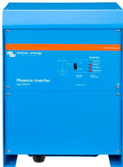
Phoenix Inverter 24/5000