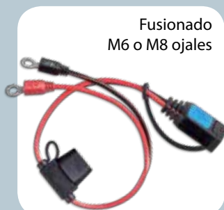
Fusionado M6 o M8 ojales