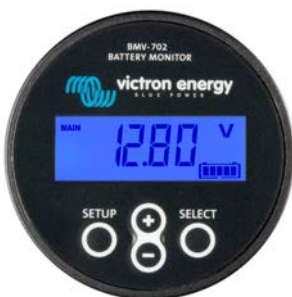
BMV 702S Negro