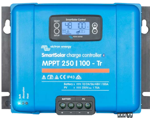
Controlador de carga SmartSolar MPPT 250/100-Tr Con dispositivo conectable