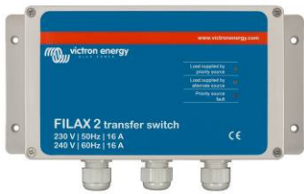
Filax-2: conmutador de transferencia ultrarrápido