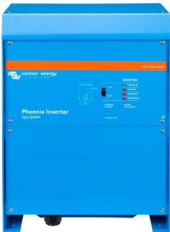
Phoenix Inverter 24/5000