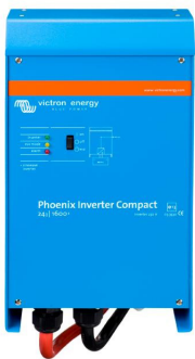
Phoenix Inverter Compact 24/1600

Todos los modelos disponen de un Puerto RS-485. Todo lo que necesita conectar a su PC es nuestro interfaz MK2 (ver el apartado "Accesorios"). Este interfaz se encarga del aislamiento galvánico entre el inversor y el ordenador, y convierte la toma RS-485 en RS-232. También hay disponible un cable de conversión RS-232 en USB. Junto con nuestro software VEConfigure , que puede descargarse gratuitamente desde nuestro sitio Web www.victronenergy.com , se pueden personalizar todos los parámetros de los inversores. Esto incluye la tensión y la frecuencia de salida, los ajustes de sobretensión o subtensión y la programación del relé. Este relé puede, por ejemplo, utilizarse para señalar varias condiciones de alarma distintas, o para arrancar un generador. Los inversores también pueden conectarse a VENet , la nueva red de control de potencia de Victron Energy, o a otros sistemas de seguimiento y control informáticos.