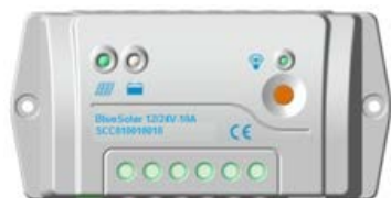
BlueSolar PWM-Pro 10 A