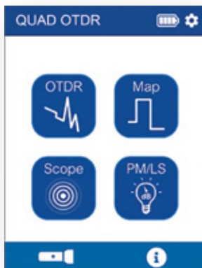
Pantalla de inicio

sus pasos, como se puede ver a continuación. Para aplicaciones FTTH/FTTx, el OTDR PON identifica los ratios de división para comprobar las redes activas o inactivas y detectar y solucionar problemas. Su longitud de onda de 1625 nm permite realizar comprobaciones en servicio de redes sin interrumpir a los suscriptores.