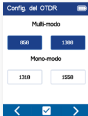
Seleccionar longitud(es) de onda