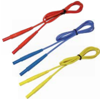
Cable 1,2 m 1 kV (conectores tipo banana) rojo / azul / amarillo