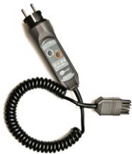
Adaptador WS-03 con botón que inicia la medición (conec- tor UNI-Schuko)