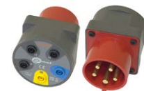
Adaptador para en- chufes trifásicos 16 A / 32 A