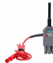
Adaptador WS-07 para medir la imp- edancia de bucle Z(L-N)