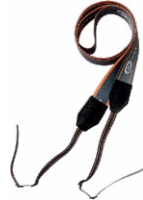
Arnés para el medidor (tipo M1)