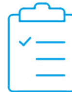
Certificado de cali- bración de fábrica