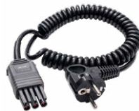
Adaptador WS-04 (conector angular UNI-Schuko)