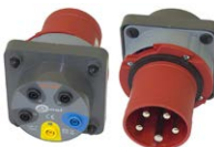
Adaptador para en- chufes trifásicos 63 A