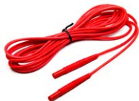
Cable para la me- dición del bucle de cortocircuito (conec- tores tipo banana) 5 m / 10 m / 20 m