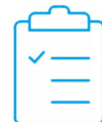
Certificado de calibración con acreditación