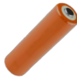
4x batería LR6 1,5 V