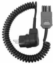
Adaptador WS-05 (conector angular UNI-Schuko)