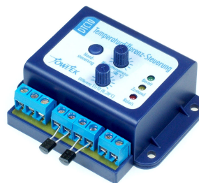
Illustration du module dans le boîtier en option sous le 19.12.92

La station météo est adaptée à l'installation dans le boîtier universel TowiTek, disponible sous le numéro de commande 19.12.92. Des feuilles imprimées et poinçonnées sont jointes à la livraison.