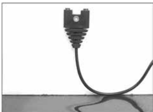
Première possibilité de montage pour de faibles niveaux d'eau