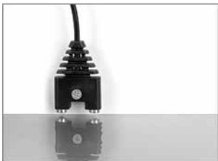
Exemple de montage (capteur d'eau)