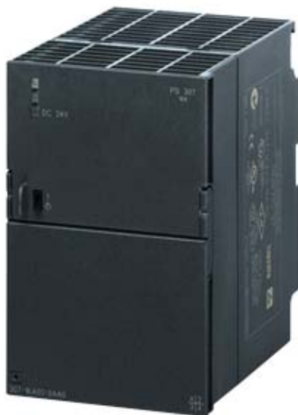
SIMATIC S7-300 ALIMENTATION STABILISEE PS307 ENTREE: 120/230 V CA SORTIE: 24 V/10 A CC