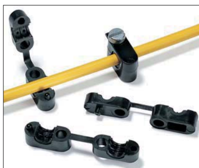
Embase de la série KK en application.