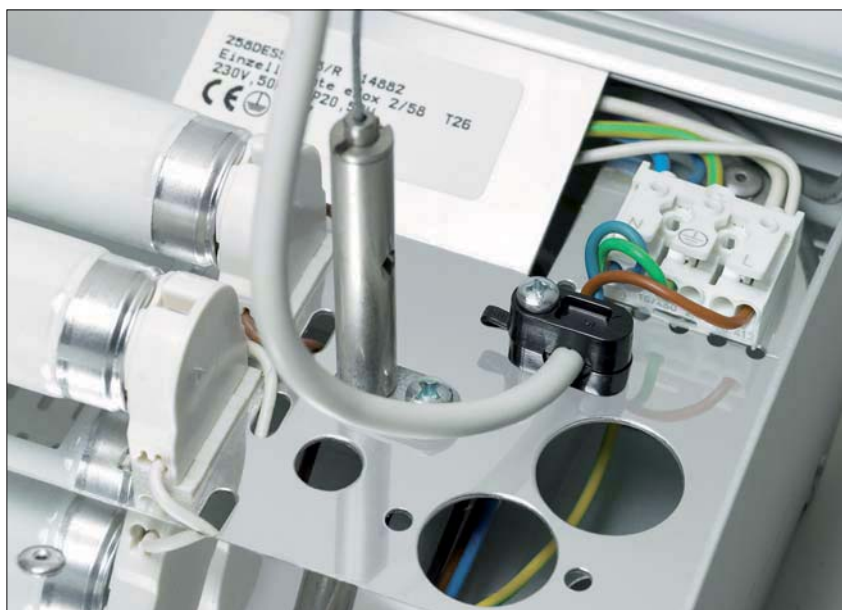
Embase de la série KK en application.

Les Klam-Klip guident et maintiennent les câbles en traction et se fixent à l'aide d'une vis. Les deux demi-coquilles sont reliées par une attache afin d'éviter la perte d'une des deux parties. Un ergot, système de blocage en rotation, évite que la partie supérieure et la partie inférieure ne tournent pendant le vissage.