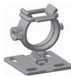
Bride R1, pour un maintien encore plus ferme (adaptée aux clips HWClip25 et HWClip35).

Pour plus d'informations sur les matériaux consulter la page 394.