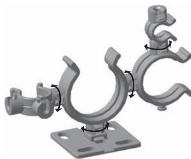
Vous pouvez assembler plusieurs clips entre eux qui peuvent pivoter librement.