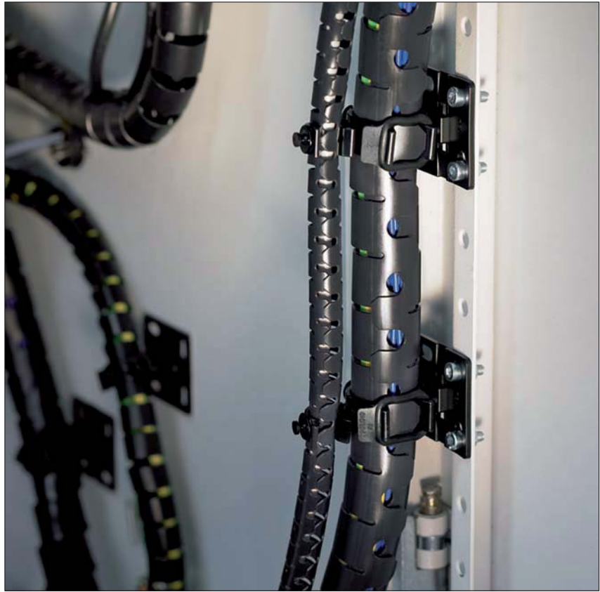
Protection, fixation et maintien des câbles avec la gamme d'accessoires Helawrap, ici par exemple utilisés dans une armoire de câblage.