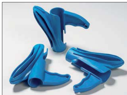
Les outils de pose sont disponibles pour toutes les dimensions de gaine Helawrap.

Grâce au nouvel outil de pose HAT l'utilisateur peut constituer des faisceaux rapidement et facilement. L'outil de pose a été optimisé pour glisser en douceur et de manière fiable dans la longueur de la gaine facilitant ainsi l'insertion de câbles dans Helawrap. Le design unique permet également de sortir des câbles individuels de l'outil et de les dériver à travers les ouvertures de la gaine. Un outil est joint à tout conditionnement Helawrap. Des outils supplémentaires peuvent être achetés séparément.