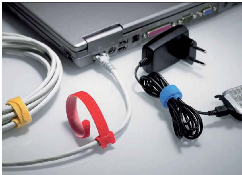
La grande variété de couleurs des TEXTIE permet une identification aisée.

Les TEXTIE représentent une solution efficace pour un maintien souple des câbles, notamment pour les fibres optiques et les câbles de réseau ou de téléphonie. Les TEXTIE sont aussi très utiles pour des installations temporaires, comme lors de salons, manifestations événementielles, ainsi qu'à la maison.