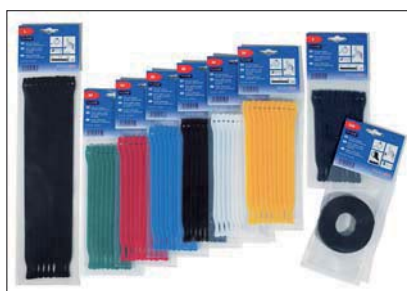
Les colliers TEXTIE sont disponibles en différentes couleurs et tailles.

Embases de fixation disponibles sur demande. Merci de nous contacter !