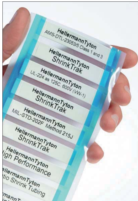
Repères ShrinkTrak en format échelle avec prédécoupe sur les côtés pour une utilisation facile.