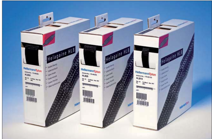
Helagaine HLB : tout est dans le taux d'expansion ! Avec seulement 3 tailles en boîtes distributrices, Helagaine HLB couvre la plupart des diamètres standard.

Parce qu'Helagaine HLB est fournie en dévidoir très pratique et qu'elle permet de couvrir une large gamme d'applications avec peu de tailles, elle est idéale pour les utilisations professionnelles ou domestiques. Helagaine HLB permet la mise en faisceau et la protection des câbles et offre également une bonne résistance à l'abrasion.