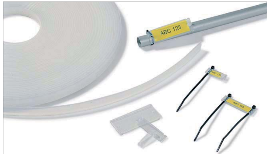
Helafix HC et HCR pour toutes les identifications.

Dans le domaine électrique, ils sont utilisés pour le marquage de câbles, de faisceaux électriques ou conduits de machines.